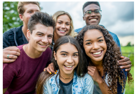
This institution is an equal opportunity provider.